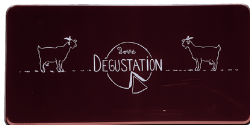
COINS ROUNDS 400 x 200