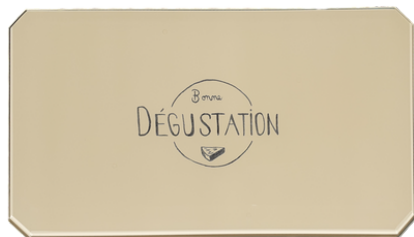
350 x 200 mm PANS COUPES