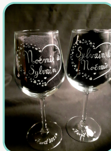
ex : date sur le pied